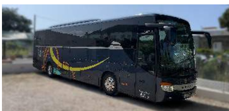
Setra 415 GT-HD

48 Sitzplätze mit großer Beinfreiheit Abstandsregeltempomat Notbremsassistent Küche WC TV Frontkamera 2 Kühlschränke