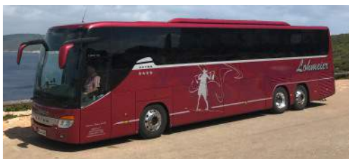
Setra 416 GT-HD